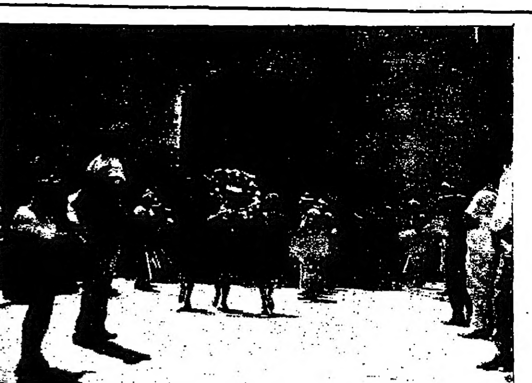
في باب العمود بالقدس: ثلاث سيدات يحملن أكفالا من الزهور طيلة المظاهرة الضخمة التي فرقها البوليس الإسرائيلي بجزائره الضخمة